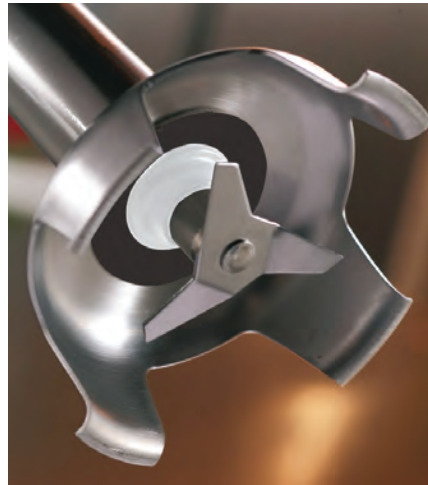
Spezielle Form des Klingenschutzes

1. Tolle Sache: Spezielle Messerform (spritzt weniger). Das Smart Drehzahlregelungssystem begrenzt die Geschwindigkeit, sobald das Werkzeug keinen Speisekontakt mehr hat.