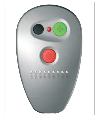
Steuerung mit Überlastungsalarm

4. Das Drehzahlregelungssystem begrenzt automatisch die Geschwindigkeit bei Überlastung. Sie arbeiten weiter. Eine tolle Sache!