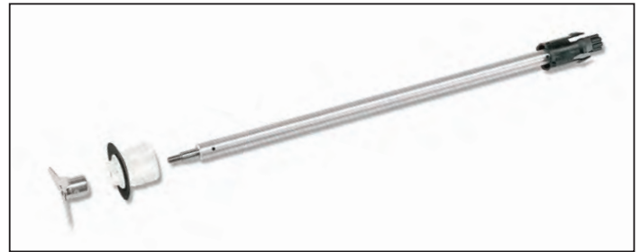
Demontage des kompletten Edelstahlschaftes ohne Werkzeug.

1. Reinigung in Sekunden: Ohne Werkzeug lassen sich Klingen, Schaft usw. demontieren → ab in die Spülmaschine! Versteckte Ecken gibt es beim Bermixer nicht.